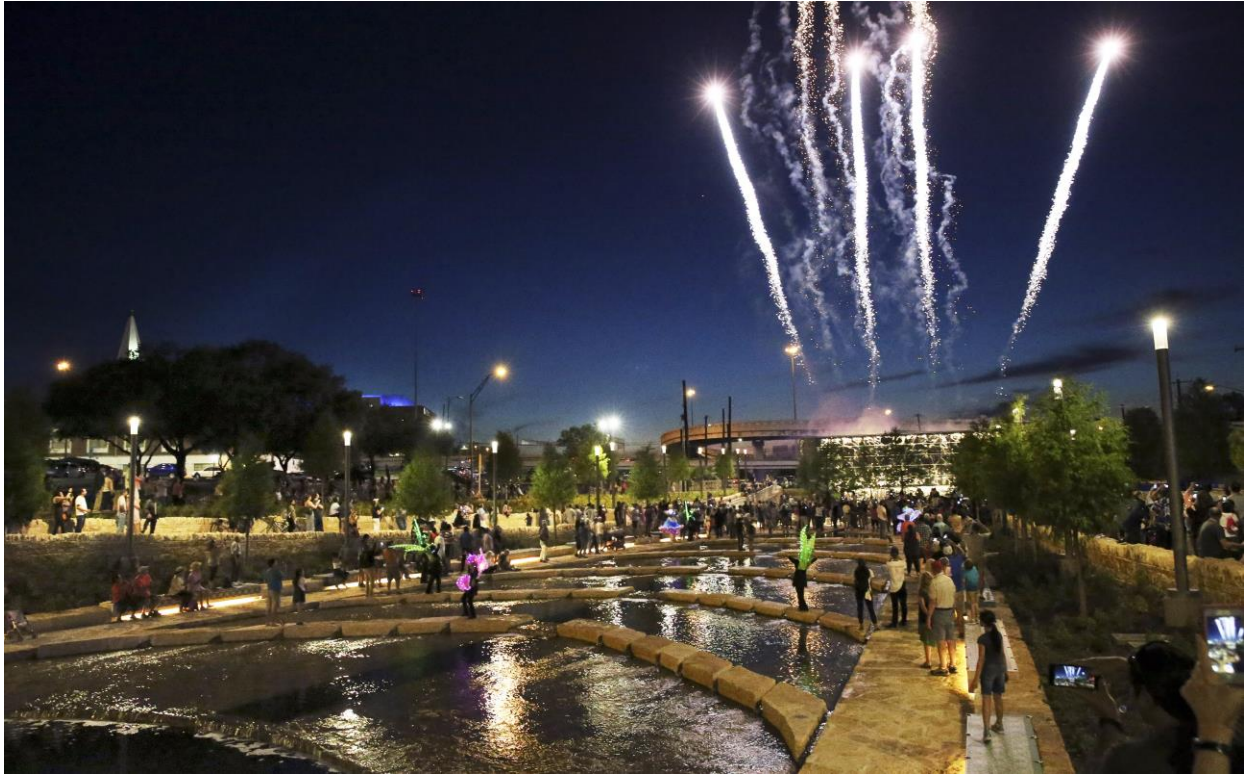
Gran Apertura del Parque Cultural del Arroyo San Pedro (Etapa 1.1), 5 de mayo de 2018 Vista de la Plaza de Fundación (ubicación de la obra de arte no fotografiada)