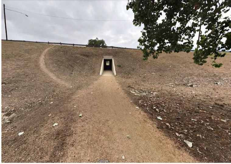
Paso subterráneo peatonal actual en Pleasant Valley – Vista este