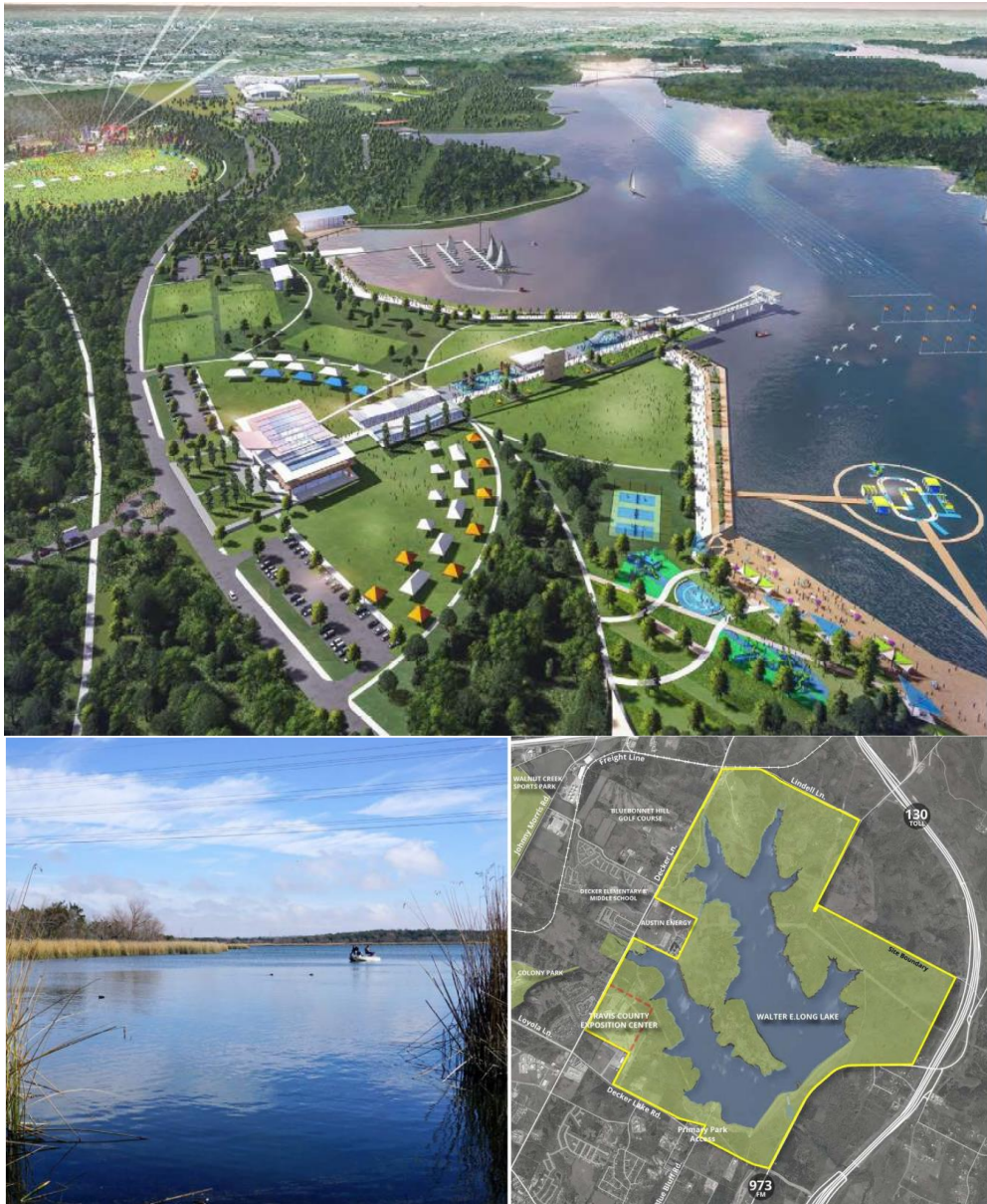
Walter E. Long Metro Park es reconocido regionalmente por su hermoso lago con los recursos naturales que lo rodean, y también como un lugar de pesca excepcional.

Se encargará a un solo artista o equipo que diseñe, fabrique e instale dos obras de arte, una en la entrada de cada parque. Estas obras de arte tridimensionales servirán como elementos de entrada para aumentar la visibilidad de la entrada principal de cada parque. Las obras de arte deben capturar el carácter único de cada parque. El artista o equipo seleccionado trabajará en colaboración con el equipo del proyecto y el personal de AIPP para integrar su obra de arte en el conjunto general de mejoras del parque.